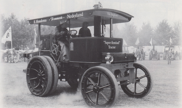
Dampftraktor einmal anders. Sechs-Tonnen-Sentinel in der Einzelvorführung.

Sandfontänen hinter sich werfend, sowjetische Panzer und andere Militärfahrzeuge aus dem Zweiten Weltkrieg durch den Sand. Amphibienfahrzeuge wagen sich mit ihren stolzen Eignern ins Gooimeer. Ein großer Parkplatz gefüllt mit englischen und amerikanischen Militärfahrzeugen aus der Zeit vor 60 Jahren bildet den Rahmen. Wei-