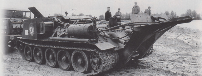
Sowjetischer Bergepanzer von 1944 mit Erdsporn. Hier hält jeder Abstand beim Einparken.

Jährlich mehrfach führte der Weg über Holland über Großbritannien, bis ein Bekannter mich 1990 auf eine Dampftralle in der Nähe von Amsterdam aufmerksam machte.